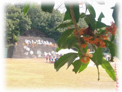
金木犀の香りがします

これからの時代を生き抜く子ども達は、様々な立場・価値観を受け入れる力が求められています。そのためにも、我々大人が、かつては普通、当たり前と思われたことからの脱却が必要なのかもしれません。